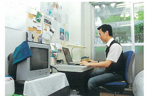
▲ 寮室内 Dormitory Room