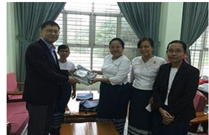
学長、副学長、帰国留学生らと With rector, pro-rector, and former int'l student