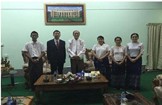
ヤンゴン工科大学 元学長らと Meeting with former rector of YTU