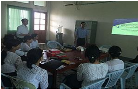
コンピュータ・システム(ハードウェア)研究室でのセミナー Seminar at Computer Systems (Hardware) Lab.

I believe this "follow-up research guidance for former international students" by JASSO is very useful for continuity of up-to-date research. We can also utilize this program for improve and enrich our education program. It is also good for vitalize and motivate prospective international students.