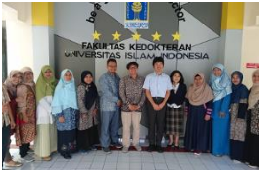
After the discussion about inter-faculty collaboration between faculty of medicine and faculty of industrial technology