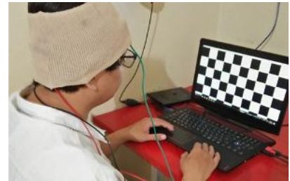
Test of evoked potential (EEG) study using portable biosignal acquisition device