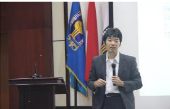
Research advisor's special lecture about biomedical engineering to researchers and students of faculty of industrial technology