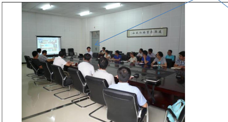
帰国留学生及びその他の研究者等を対象としたセミナー /Seminar for Former International Students and Young Faculty members