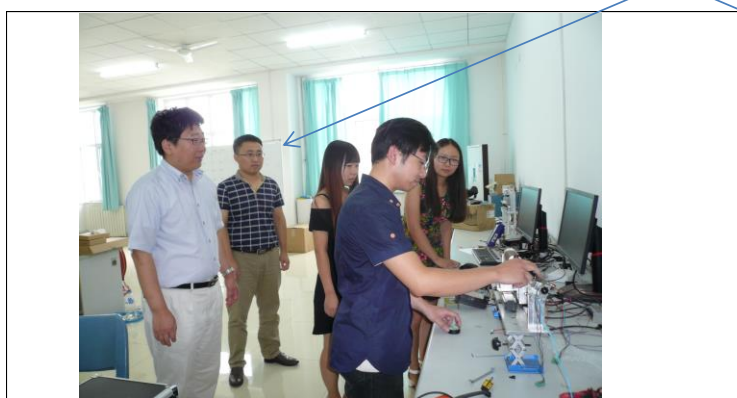
帰国留学生の研究課題指導 /Seminar Discussions with the Former International Student