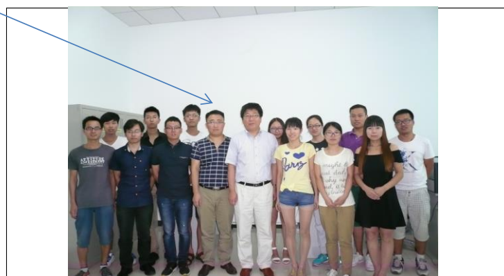
帰国留学生の研究グループとの記念写真 /The memory Photo with the Former International Student's Group