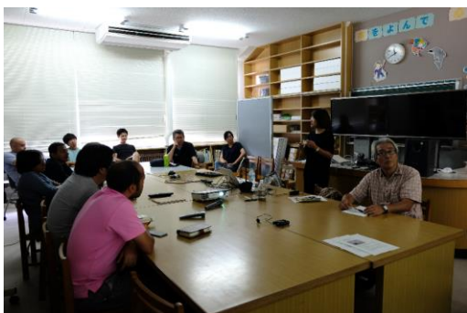
愛媛大学南予水産研究センターでのゼミ発表 Having a presentation in South Ehime Fisheries Research center