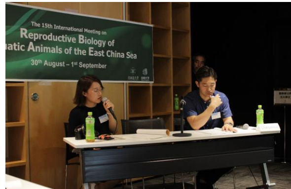
国際シンポジウムでチェアマンを行っている様子(8月31日) Holding the oral presentation session in the international symposium