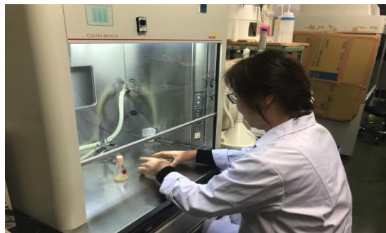
選抜したコロニーの植菌 / Inoculation of Selected colonies