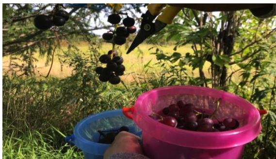
サンプル採集1 / Sample collection 1

当研究室では学生の教育はもちろんのこと、研究室の研究成果を産業を通じて地域貢献、社会貢献につなげることを目標として研究活動を行っている。今回の滞在中、このコンセプトの重要性についてHan先生とディスカッションした。中国の国土は広大で、国内には様々なバイオマスが大量に存在しており、現状において中国国内のバイオマスには様々な物質生産のための原料として利用できる可能性が多分に残されている。Han先生は今後中国東北部にある様々なバイオマスを原料としてセルロースを含む有用物質を生産可能な微生物のスクリーニングを行う予定であり、生成物の分析などに関して引き続き指導を行う予定である。また、現在Han先生が研究代表者である国際共同研究も進めており、引き続きHan先生とはメールでの意見交換、Han先生が来日した際には直接指導しながらプログラムを進める予定である。