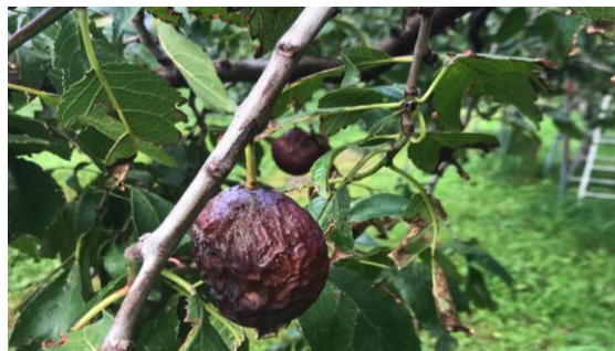
サンプル採集2 / Sample collection 2