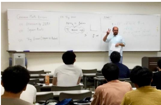
講演風景 / Lecture with discussion

本研究期間において、査読過程にある1編の投稿論文を改訂し、近々投稿予定の2つの論文を新規に作成する作業にも外国人研究者はかかわった。研究者として研究を実質的に推進する能力を獲得しつつある。投稿予定の論文のうち、強度変調放射線治療の新しい計画法として、放射線ビーム係数だけでなく線量の一部も同時に最適化することで高精度な治療計画を実現するアイデアは、特に、早い機会の論文公表が必要であると考えている。外国人研究者の帰国後も電子メールやテレビ会議システムにより連絡を密にして交流し、今後も継続して研究を活発に進める予定である。