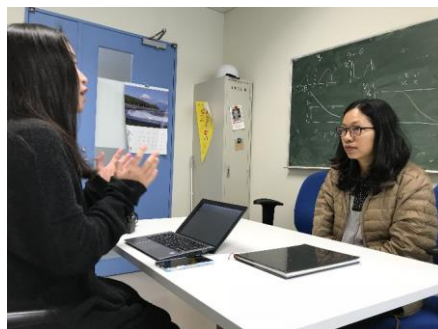
東北大学理学部物理系同窓会の取材 An interview for the alumni at Tohoku University