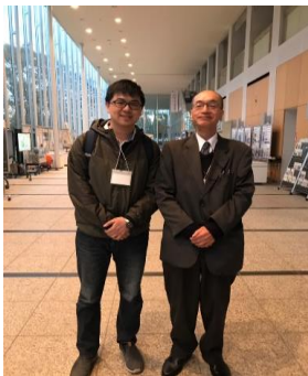
防災科学技術研究所にて学会に参加/The conference at NIED

本研究では、進行中の気候変動にともなう斜面崩壊特性の変化を予測したが、将来の気候は人間活動の変化や炭素削減の効率など様々な影響を受けて大きく変わるため、不確実性に満ちている。したがって、斜面崩壊の将来の変化の分析は、単一のシナリオのみでは説明が困難な面がある。本研究の結果を踏まえた将来の研究では、より多くの気候変動シナリオを取り入れ、アンサンブル法の応用により、信頼性の高い結果を取得することを目指す予定である。このような研究は、今回の研究対象地域である台湾のみならず日本でも重要であり、台風の襲来と急峻な山地といった両国の共通点も多いので、今後も日台の共同研究として実施予定である。