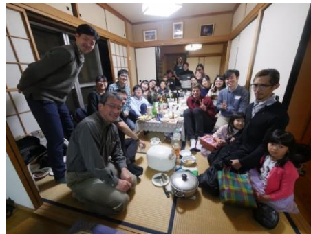
受入研究者の自宅でのパーティーに参加/Home party at research advisor's home