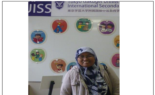
東京学芸大学附属国際中等教育学校での調査(2016年1