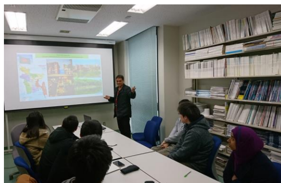
セミナーでのプレゼンテーションの様子 Presentation on the lab seminar