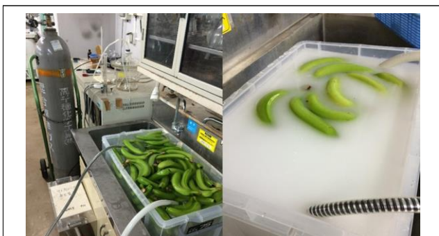
Ethylene micro-bubble generation system apparatus

今後は、マイクロバブルの収穫後果実の貯蔵における有用性について、エチレンガス、その他の気体を用いて双方で実験を行い、情報交換を行ってゆく。さらに、それぞれの大学間における学生の交流による共同研究の推進についても検討してゆく予定である。