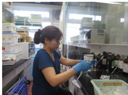
室内空気試料の前処理 Pretreatment of indoor air samples