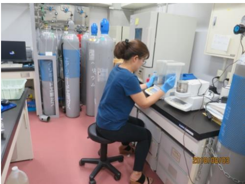
化学物質の標準品を精秤 Weighing standard substances of target chemicals