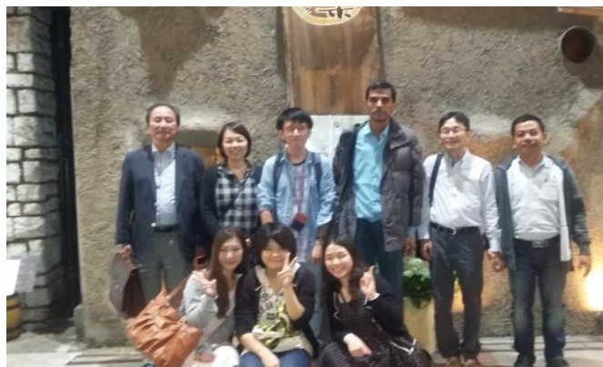
With Laboratory members