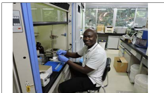
実験室での試料前処理風景 Sample preparation in the laboratory