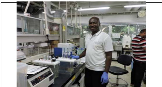
実験室での試料前処理風景 Sample preparation in the laboratory

本外国人研究者は、本学で博士号を取得後、ガーナ国の残留性有機汚染物質に関する委員会のメンバーに加わるなど、本国での活躍の機会が増えている。また、研究能力も、意欲も高く、今回の2ヶ月の滞在期間中にも多くの分析作業とデータの解析作業を進めていた。これらの成果については、今後もメール等で議論を続け、論文として発表したいと考えている。さらに、今回の滞在期間中に、受入研究者の私と協力し、日本の研究を支援する財団に対し共同研究の提案を提出した。これが採択になれば、相互の訪問等を通じて共同研究を続けられると期待される。また、採否に係わらず、メール等を通じた研究協力は続けることができると考えている。