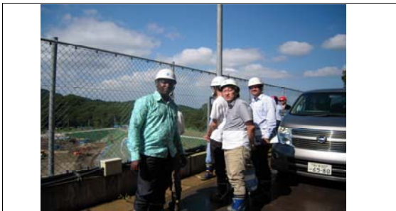
管理型廃棄物最終処分場の見学風景 Technical visit to a waste landfill site