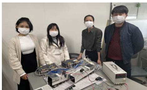
学生の研究課題に関する意見交換／Discussion about the experimental work conducted by students.

研究課題は帰国留学生の出身国（ミャンマー）における電力インフラの整備に関連している。今回の研究で得られた成果は早急な対策が求められている配電システムの改善業務に直接寄与できる。また、本研究課題は短期間に解決できるものではなく、長期間に亘る取り組みが必要であり、短期研究終了後も間断ない研究の推進が不可欠である。外国人研究者は帰国後も、ヤンゴンにおける配電システムの供給信頼性向上に関する業務に従事する。したがって、受入研究者は引き続き学術的な観点から指導を行うことができる一方で、外国人研究者はフィールド試験が可能となり、今後も研究課題に関する研究を協同で推進することができる。また、今回得られた知見や人的ネットワークは、外国人研究者のその後の研究推進や業務遂行に大いに役立つことが期待される。