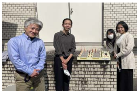
教員の研究課題に関する意見交換／Discussion about the experimental work conducted by another professor.