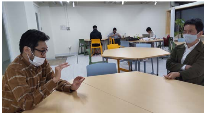
研究内容についての意見交換 /Discussion on the Research