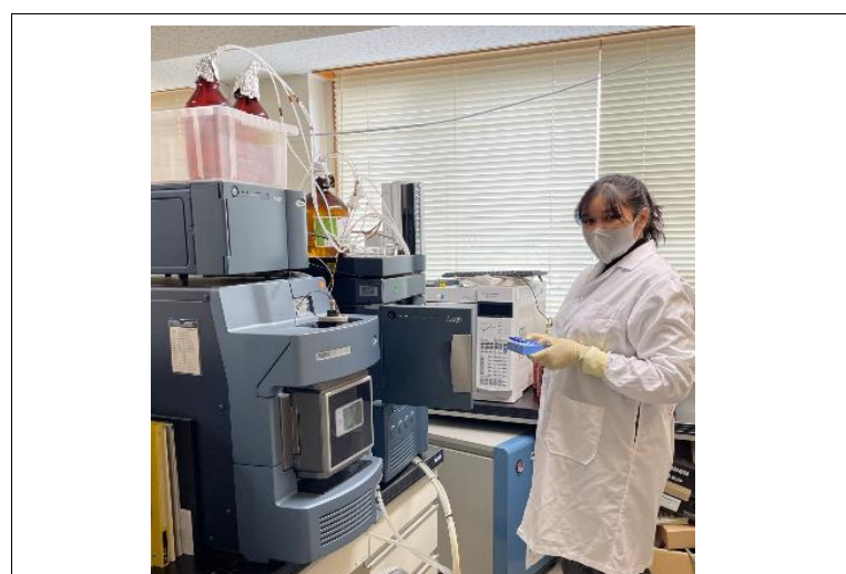
LC-MS/MSによる抗生物質濃度の分析/Analysis of antibiotics concentration using LC-MS/MS