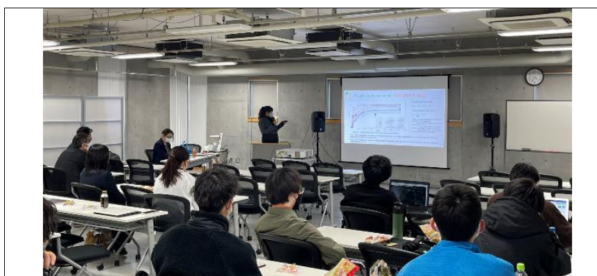
学内研究会での発表の様子/ Presentation of the research