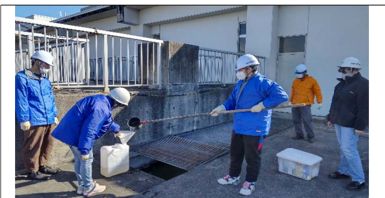
下水サンプルの収集/ Collecting the sewage sample