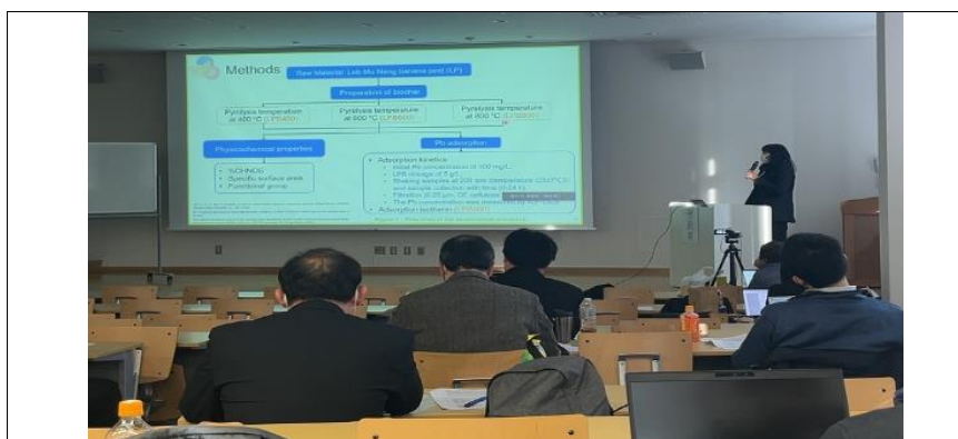
東北大学での学会発表の様子/ Conference at Tohoku University