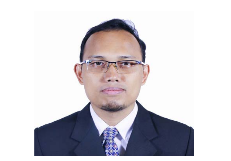
写真タイトル 日/英