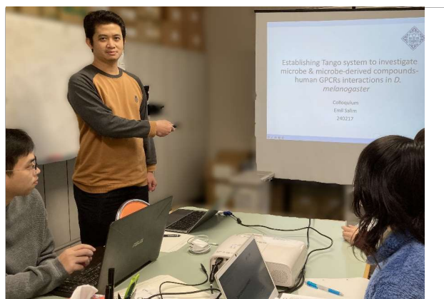
研究報告会 発表風景