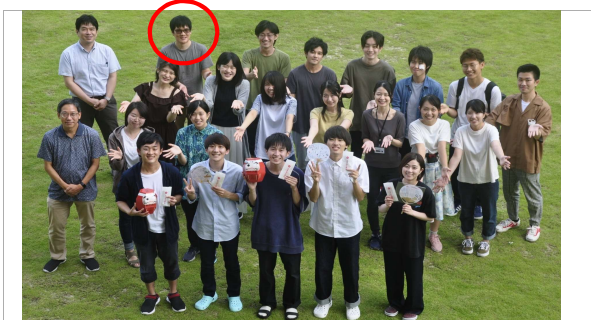
Laboratory of Microbial Technology's members