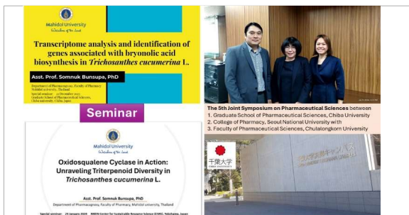
Seminar and Conference