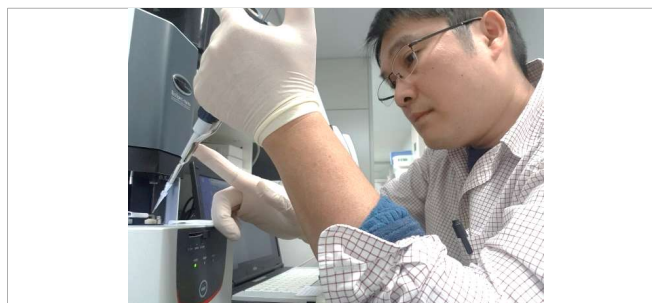
Plasmid extraction, quantify and assess purity using microvolume