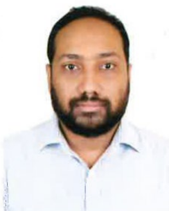
KABIR K M MAHMUDUL (コビル ケー エム マハルドウル)