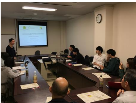
東京大学における研究成果発表の様子 / Seminar delivered at the University of Tokyo (October 15, 2018)