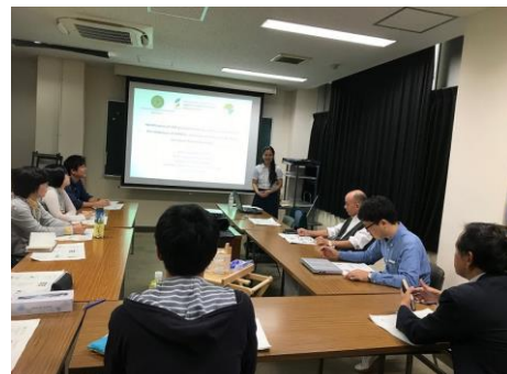
東京農工大学における発表の様子 / Seminar delivered at Tokyo University of Agriculture and Technology (October 18, 2018)