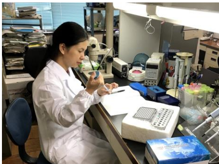
東京大学における実験風景 I / Conducting experiments at the University of Tokyo (September 19, 2018)