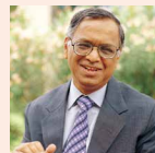
N.R. Narayana Murthy 氏 (Infosys 創始者)

本学 President's Council メンバーを経て、Global Advisory Board 委員