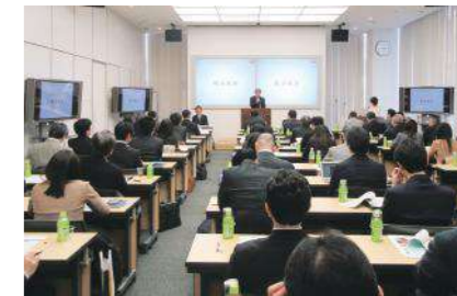
総会(田町キャンパスイノベーションセンター) 2017年3月16日開催