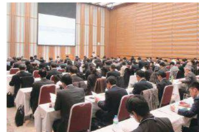
設立総会(経団連会館) 2016年3月11日開催

活動報告や今後の活動予定を発表するなど、産学官の協議・情報共有の場として年に数回開催しています。