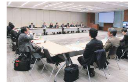
世話人会(東京・三菱商事) 年3回開催