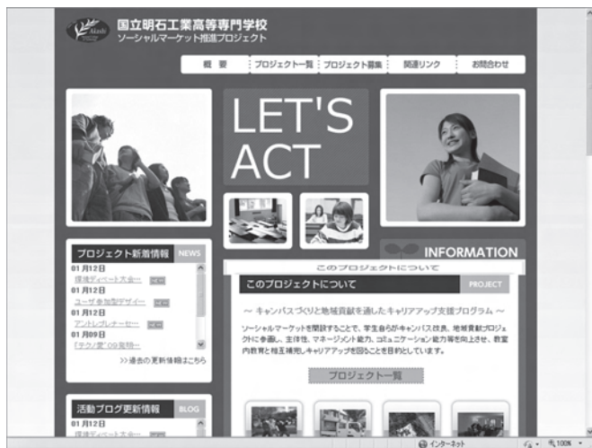
ソーシャルマーケット推進プロジェクトHP

現在は、ソーシャルマーケット内で二五のミッションが活動中です。また、プロジェクト専用のホームページ（ http://act-market.org ）を開設して、それぞれのミ