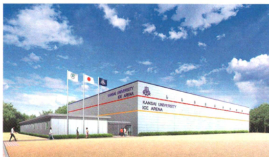
アイスアリーナ完成予想図