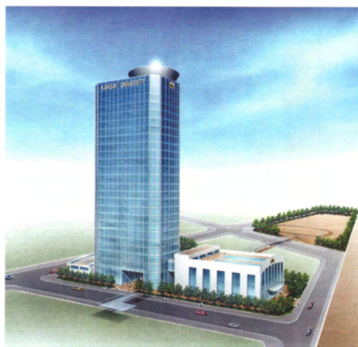
高槻駅前キャンパス（仮称）完成予想図

新キャンパス構想が着々と進行していることをご紹介します。すなわち、JR高槻駅前に、30階建ての超高層学舎を建設して、幼稚園・小学校から大学院までの一貫教育、さらには生涯学習まで実現しようというものです。関西の有力私立大学の代名詞としてよく「関関同立」といわれます。これらの4大学がこぞって小学校の設立を目指しており、京都の「同立」はすでに開校しています。関西大学としても新たな飛躍を求めて高槻駅前に新キャンパスを構えるべく新プロジェクトが進行中です。