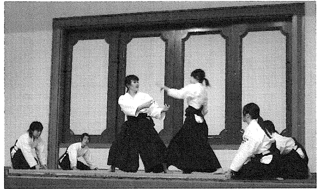
写真1 護身術講座実演風景

そして最後に本学健康管理センター医師から女性の健康面での諸注意と、上手な病院へのかかり方、持病を持つ学生のための病院紹介について指導している。さらにもう一つ付け加えるならば、この防犯セミナーの資料として使用している冊子であるが、これは京都府警察本部の依頼に基づき、本学学生と警察が協力して作成した「京都で女性が一人暮らしをするために」(写真2)を新入生全員に配布し、在学時のみならず、社会人になった時にも役立つ参考資料として活用できるようにしている。