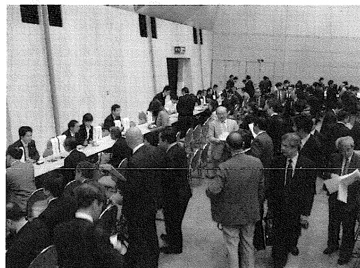
就職ガイダンスの様子

工業株式会社山本人事部長より「沖電気工業の採用・人事戦略」と題する講演が行われた。その後の情報交換会では、企業ごとに担当者が着座するブースを設置し、学校側の担当者が任意に訪問する形式で活発な情報交換が行われた。