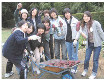
宿泊研修で焼きいもに挑戦

進路支援は、キャリアセンターを中心に実施。入学直後から継続的に進路選択に関する支援を行っています。履歴書・エントリーシートの書き方、Uターン就職、自己分析といった内容のガイダンスを開催。企業の人事担当者を招いての企業セミナーや、就職が内定した先輩の話や聞く機会も用意しています。インターネットを利用した本学独自の就職情報検索システムでは、学内はもちろん自宅からでも約2万社の最新企業情報や求人情報を見ることができます。また、教員採用試験を目指す学生たちには、特別講座を開講し、授業以外でもバックアップしています。