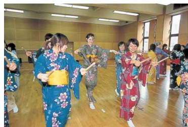
日本舞踊（共通教育科目）の授業

各学部・学科のカリキュラムではそれぞれ専門の知識や技術を深めることができます。さらに学生の学ぶ意欲を尊重し、学部・学科・学年に関係なく約300科目の中から自由に選択できる「共通教育科目」を開講。総合大学なら