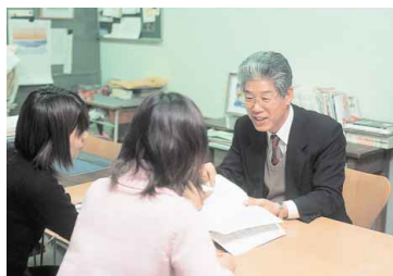
オフィスアワーに教員を訪問