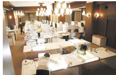
甲子園会館のスタジオで設計演習