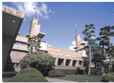
庭園から見た甲子園会館

学生からの質問や相談に対応するため、各教員に「オフィスアワー」（週1回90分）を設けています。あらかじめ指定された時間帯に教員は研究室に待機、学