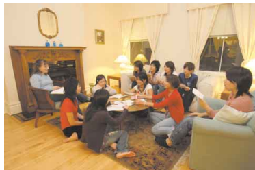
寮でアメリカ人学生とのチュートリアル（アメリカ分校）