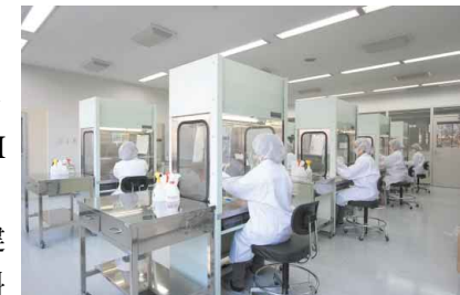
臨床薬学教育センターでの製剤実習

中央キャンパスは、文学部、生活環境学部（建築学科除く）、音楽学部、短期大学部全学科のメインキャンパスです。日本図書館協会の