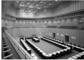
国際交流会議場(円卓)