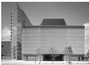
プラザ平成正面入口

このたび当館では、平成一九年四月より、ご利用いただいた方々からのアンケート結果等をもとに会議施設利用料金の改定を行いました。新料金は従来料金に比べ、最大約半額*となり、ご利用いただきやすくなっております。（*延長料金は除く）