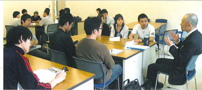
キャリア・Re-デザインI/社会人インタビューで観察する学生ファシリテータ

ファシリテーションとは、「協働促進」と翻訳され、集団での活動を円滑に運べるよう支援するスキルを指します。このファシリテーションを行う人のことをファシリテータといいます。たとえば、会議の場では、参加者の発言を促したり、進行内容をまとめて参加者の合意を得たり、会議のプロセスの舵取りをする人がファシリテータにあたります。