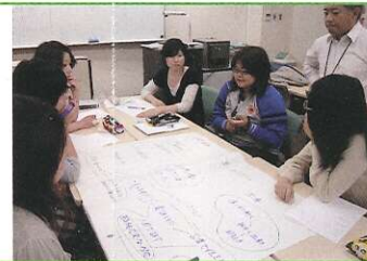
キャリアデザインの基礎設計