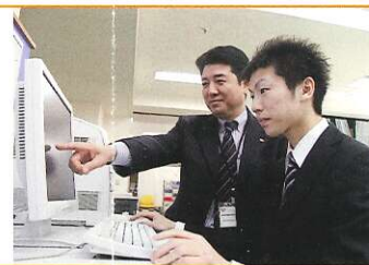
具体的就職活動プランの作成と対策