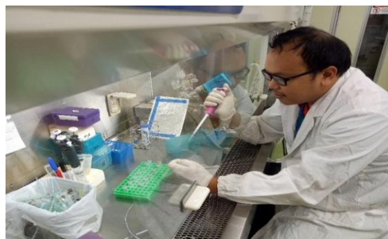
Preparation of reaction mixtures 反応系の準備