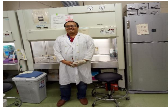
In front of Biosafety Level 2 cabinet バイオセーフティレベル2 安全キャビネットの前