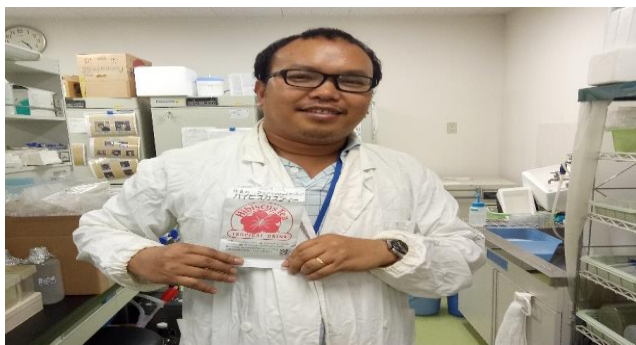
With the Hibiscus tea ハイビスカスティーと

外国人研究者は、自国フィリピンにおいて、様々な植物の成分について抗インフルエンザウイルス活性の探索を行いたいと考えている。同国では、健康維持増進のために様々な植物が用いられているが、その活性について十分に調べられていないものが多い。今後は、それら植物からの抽出物について、今回習得した技術を活かした研究が行われることが期待される。当研究室で推進している研究の方向性とも一致することから、密な連携をとりながら共同研究としての推進を目指したいと考えている。