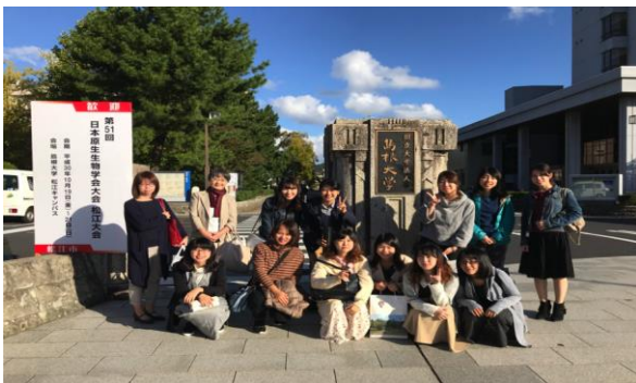
第51回日本原生生物学学会大会に参加/Participation in the 51st Annual meeting of the Japan Society of Protistology (Matsue, Shimane Prefecture)

引き続き、カイヤン ( Pangasianodon hypophthalmus ) における IGF 系遺伝子の遺伝的変異と成長形質との関連性の検討、2) ゲノムとトランスクリプトーム解析を行い、カイヤンの成長形質のためのマイクロサテライトと SNP マーカーを開発すること、を計画している。今回の訪問により、新たな共同研究の可能性も生まれ、今後の研究の進展に大きな一歩を踏み出すことができた。