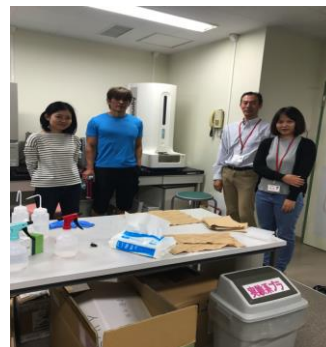
国立研究開発法人水産研究・教育機構 中央水産研究所 水産生命情報研究センター ゲノム情報解析グループを訪問 /Visit to the National Research Institute of Fisheries Science, Research Center for Bioinformatics and Biosciences, Genome Informatics Group