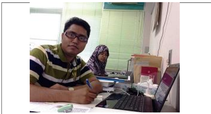
山口大学でのデスクワーク/Desk Work

帰国後は、口腔細菌の研究で得られた知見を基に、コレラ菌にAI-2不活化酵素を作用させ、病原性やバイオフィーム形成にどのような影響を及ぼすかを調べていく。今後も引き続き研究指導を行っていき、外国人研究者の母国での研究の発展をサポートする。また、筑波大学への訪問で形成された関連分野の若手研究者とのネットワークも利用しながら、研究を進めさせる。