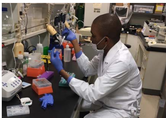
ゲノムDNA抽出作業/Performing genome DNA extraction