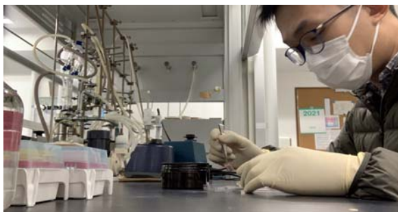
Fabricating perovskite solar cells ペロブスカイト太陽電池を作る様子