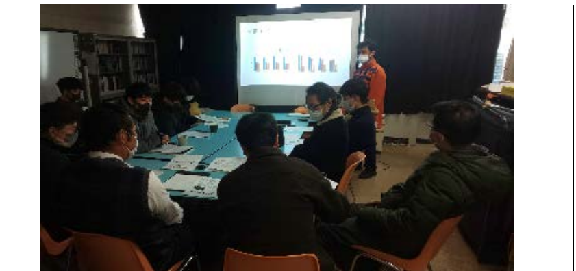
ゼミ時の写真/The photo from seminar