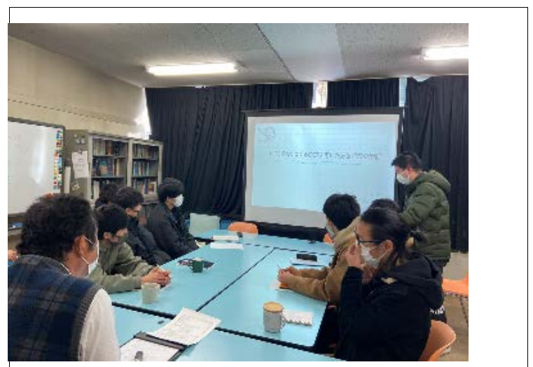
研究成果の発表/Reporting the research results