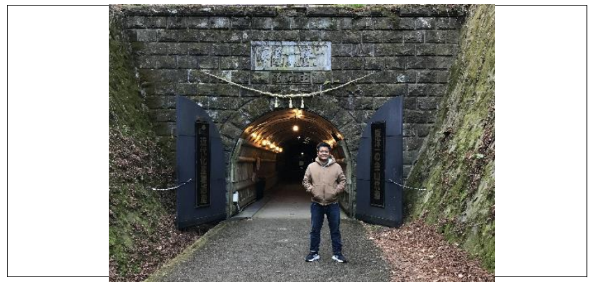
地質巡検にて鯛生金山跡や火山・地熱地帯を訪問/Field trip at Taio gold mine and volcanic-