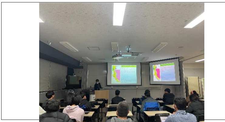
若手研究者に向けたハイブリッド講演の様子/Hybrid type lecture for young scientists