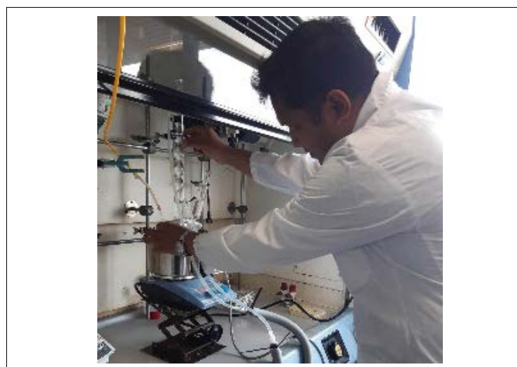
ハイドロゲル作製の様子/Preparation of hydrogels