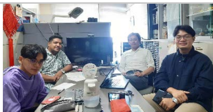
インターンシップ生との研究打合せ/Discussion with internship students