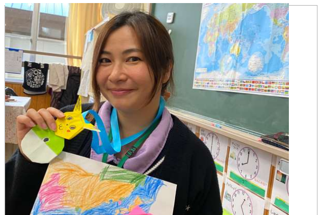
小学校での授業後に記念品を受け取る研究者/A researcher received handmade gifts from elementary school students