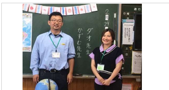
小学校での授業の様子/A class in an elementary school