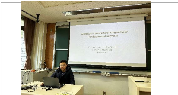
AI解釈性についての研究発表