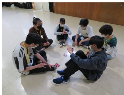
社团活动的合宿上与朋友一起玩卡牌游戏