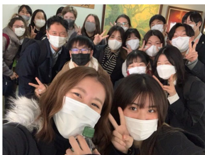
到日本高中访问时与日本的高中生的合影