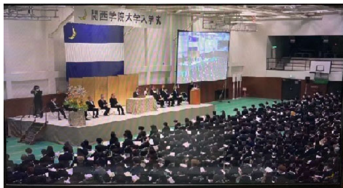
因为入国限制而参加了线上开学典礼

与关东地区相比，我更喜欢关西地区。在我的印象中，关西人干脆利落，善于交际，这与我家乡的气氛相似，所以为了尽快适应新环境我选择了关西地区的大学作为我的目标院校。我在一本关于日本的大学的宣传册上看到了对关西学院大学的介绍，并对这个美丽的校园一见钟情。然后我就去了关西学院大学的官方网站，收集了学校校风、教授及其实验室等信息。最后考虑到自身的职业规划，选择了自己最感兴趣的专业。