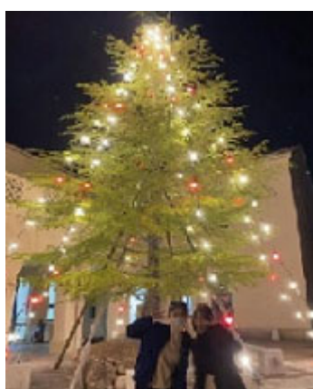
时隔两年的圣诞点灯仪式