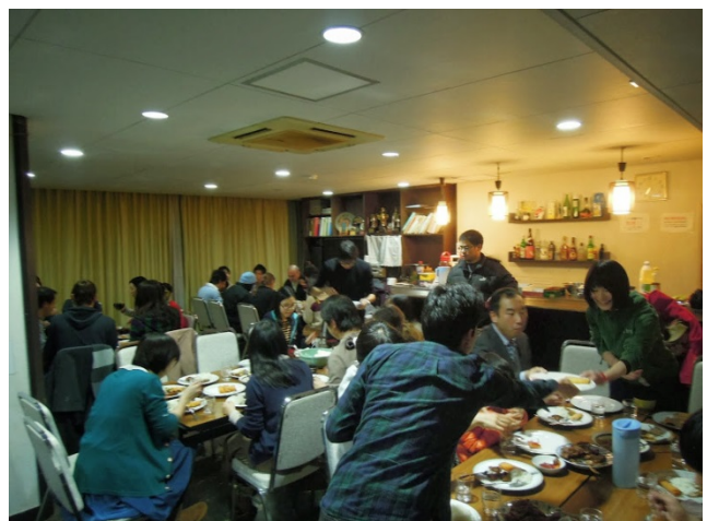
写真 3 COMMONミール（夕食会）

もう一つの重要な柱は、平均して月に2度ほど（初期では毎金曜日）、ハウスマザーとCOMMONミール当番の寮生達を作る各国料理を一緒に楽しむ夕