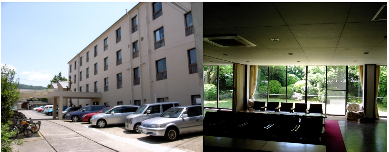
写真 1（公財）京都国際学生をの家の概観

最近、テレビを見ていると留学生と日本人と一緒に生活する寮が東京にできたということ、大きく取り上げていました。素晴らしいことだと思いますが、私が現在理事長をしている京都・聖護院にある（公財）京都国際学生の家は、半世紀前から留学生と日本人と一緒に生活している国際学生寮です（写真1）。私は、これまでに3度、1度目は学生として（50年前に2年間）、2度目（40年前に2