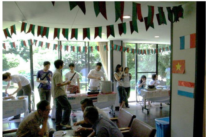
写真 4 国際食べ物祭

前期には、「食」を通じた「地域住民との国際交流」と位置づけた「国際食べ物祭り」という行事があります（写真4）。地域の皆さんをご招待して、各国のお国自慢の料理を提供して留学生達との触れ合いを行っています。後期には学寮をサポートして下さる方々や団体の方々をご招待して、各国のお国自慢の料理と感謝の気持ちを表す「感謝祭」という行事も行っていきます。