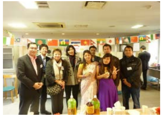
入居者歓迎パーティの様子2

国人留学生の母国語で説明、対応することで説明時の認識のズレをなくし、近隣住民とのトラブルなどを未然に防ぐことにつながっている。ルネッサンス21箱崎では年に2回、入居者歓迎パーティーを実施しており、当社スタッフと外国人留学生の懇親を図っている。そのような場でLINEやWeChat等のSNSのアドレスを交換することで関係は更に親密になり日本における母国の先輩として様々なアドバイスも行っているようだ。今後も様々なサービスや商品を開発し展開することで外国人留学生の更なる生活環境の改善に尽くしていきたいと考えている。