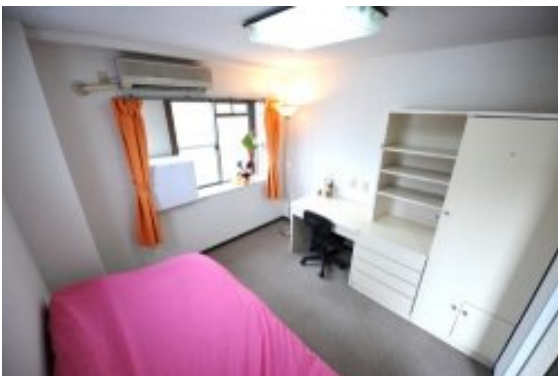
家具付き賃貸・マンスリーマンションの一例

次に、外国人留学生向けアパートおよび宿舍の事例で、 家具付き賃貸・マンスリーマンション を紹介したい。家具付き賃貸・マンスリーマンションとは、入居したその日から普通の生活ができるよう、家具、家電や食器類等の備品が既に準備されている賃貸住宅である。入居時に必要な金額も一般賃貸と比べて安く、特に海外からのお客様や転勤族など短期滞在者に人気がある。以下に家具付き賃貸・マンスリーマンションの一般的な賃貸借条件を示す。