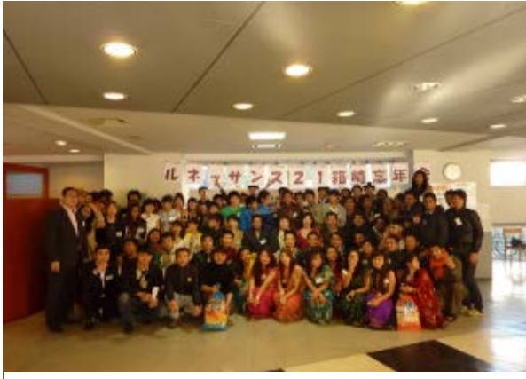
入居者歓迎パーティの様子1

このようにサブリースや自社商品の提供を行うことで外国人留学生に安心安全な住環境の提供を行っており、三好不動産は平成25年には福岡県から「ふくおか共助社会づくり表彰の地域貢献活動部門賞」を受けることが出来た。三好不動産の最大の強みは10名の外国人社員が在籍していることにもある。英語、中国語、フランス語、韓国語での対応が部屋探しから退去まで一貫して提供出来ることである。外