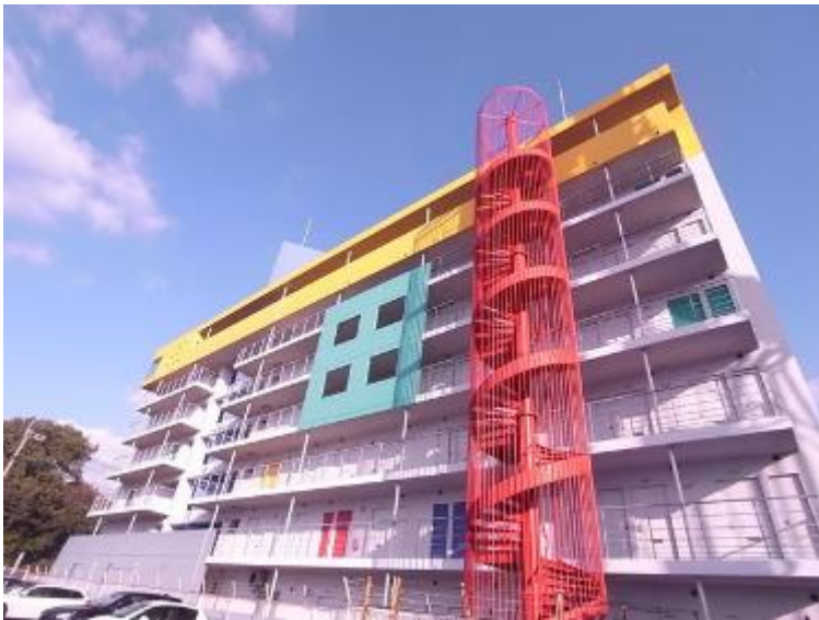
ルネッサンス 21 箱崎の外観

れていた建物である。当社が80戸を借上げ、外国人留学生に提供している。各住戸に浴室やトイレはあるが、キッチンはなく、入居者は食堂で食事を購入するか、または共同キッチンで調理することになる。食堂にはwi-fi環境が整備されているため、自ずと入居者が集い交流の場となっている。部屋の賃貸方法は、来日直後の外国人留学生を対象とした「学校指定寮」、福岡での生活に慣れた外国人留学生向けの「一般賃貸物件」、そして、昨今需要が増えている滞在期間3ヵ月程度のインターンシップ生への「家具家電、光熱費込のパッケージ商品」の3つに分類される。