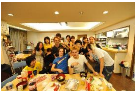
シェアハウス内の共有スペース

まず、 シェアリング型賃貸（シェアハウス、シェアルーム） について記述する。もともと「シェア」とは英語の share（分担、共同）が語源であるが、アメリカでは「ルームシェアまたはハウスシェア」、イギリスでは「フラットシェア」と呼ばれ、一軒家またはアパートを数人で借りる居住スタイルで、単身者にとってはごく普通の賃貸借形態である。諸外国においては日本の独立型の方が珍しく、単身