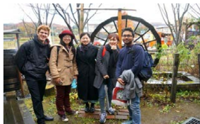
NO.4 秋保温泉と秋保収穫祭の取材 (チーム取材)(11月)