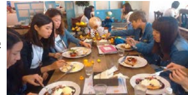
NO.2 台湾から来た大学生と、仙台街中歩きを楽しむ