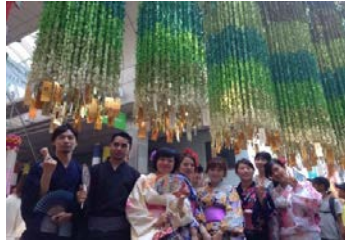
NO.1 仙台七夕取材 (チーム取材)8月

5月 事業企画 6月 留学生、日本人学生の募集 7月 参加学生への事業内容説明会 8月～1月 仙台市内および近郊のイベント、観光スポットの取材、記事の作成とSNSによる情報発信 (チーム取材 4件、個人取材 17件) 12月 台湾高校生向け「仙台街歩きマップ(繁体字版)」の発行 1月 事業まとめ