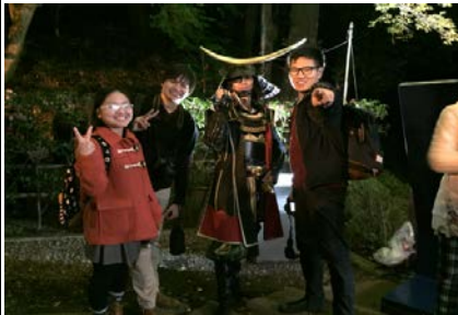
NO.3 瑞鳳殿(伊達政宗霊廟)の秋の紅葉ライトアップの取材(個人取材)(11月)