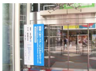
玄関前に出している案内看板